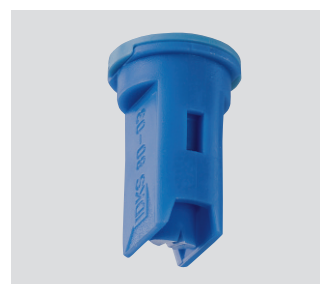
Passende Air-Injektor Schrägstrahldüse IDKS.

Typ + Spritzwinkel + internat. Düsengröße + Werkstoff = Bestellnummer IDKN 120° 04 POM = IDKN 120-04